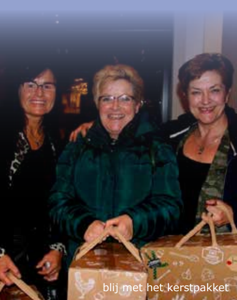
blij met het kerstpakket

Graag gedaan, aldus de voorzitter, die er samen met de overige bestuursleden trots op is dat zoveel vrijwilligers zich zo lang hebben ingezet.