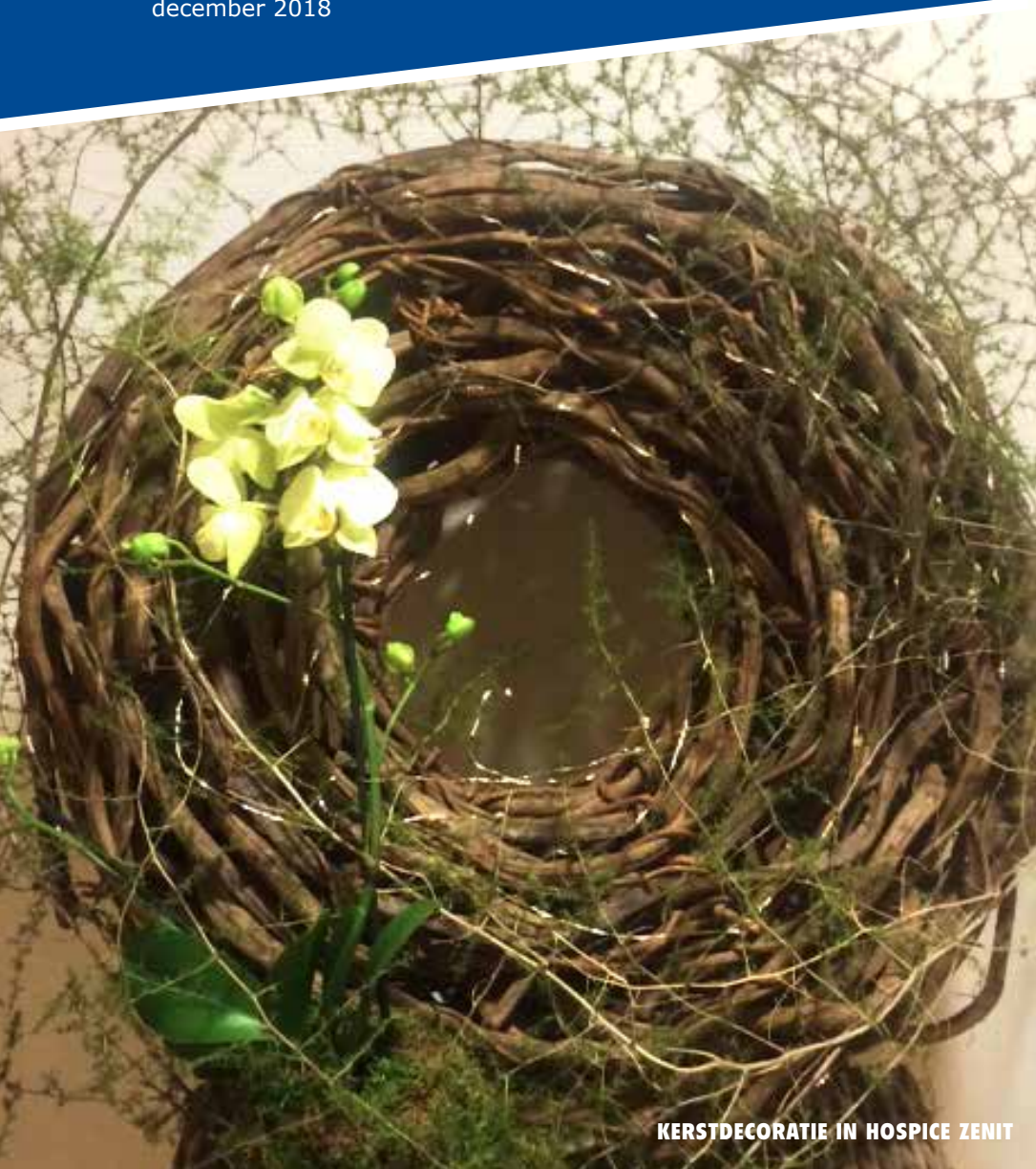
KERSTDECORATIE IN HOSPICE ZENIT

Wij wensen je vrede warmte en vriendschap, geborgenheid, koesterende liefde, gezondheid, vertrouwen, blij optimisme, zinnvolle momenten, een stralende lach, dus heel veel goeds en als het effe niet meezit een troostende hand op je schouder dat wensen wij ook je naasten en allen die je lief zijn niet alleen met Kerst en in het nieuwe jaar maar een leven lang.